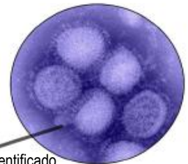
Imagen del virus H1N1 recientemente identificado, se ha tomado en el Laboratorio de Influenza CDC

C-973 Trapo Sana Trapo Desinfectante Manual Antiséptico – sólo para las manos como sustituto del jabón y agua