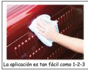
La aplicación es tan fácil como 1-2-3

la superficie y deje que se fije por 5-15 minutos. Cuando el producto se seca como una neblina - limpie con un paño limpio y suave para un brillo ¡excepcional y duradero!